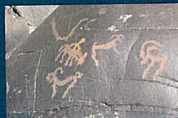
AU ZANSKAR, LA HAUTE VALLÉE DE LA TSARAP (EN HAUT) RECÈLE DES GRAVURES RUPESTRES PROTOHISTORIQUES REPRÉSENTANT DES SCÈNES ANIMALES ET ANTHROPOMORPHIQUES (CI-DESSUS).